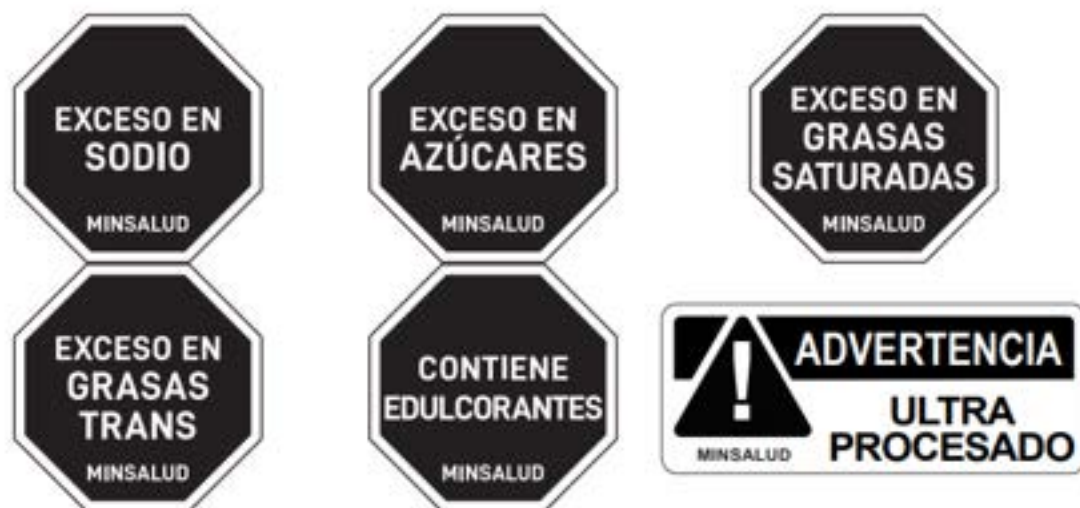
FIGURA 6. Forma del sello frontal de advertencia

Parágrafo. No se puede utilizar otro formato de etiquetado frontal, ni tipo de forma de sello de advertencia, ni cambiar el texto, tipo de letra, diagrama o dibujo, en ningún producto, independiente si lleva o no, etiquetado frontal de advertencia. De igual forma, no se puede utilizar la forma del etiquetado frontal de advertencia para incluir sellos con un texto diferente que haga alusión a otros nutrientes o cualquier componente de los productos envasados diferente a los que son objeto de esta regulación (sal/sodio, azúcares, grasas, edulcorantes, ultraprocesado).