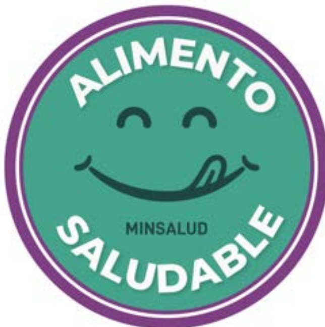
FIGURA 7. Forma del sello positivo

Parágrafo 1. No se puede utilizar otro tipo de forma de sello positivo, ni cambiar el color, añadir letras o frases, ni tamaños, ni ubicación.