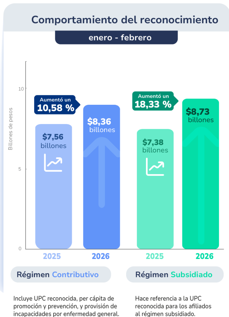
Gráfica 1. Valores del reconocimiento (2025-2026)